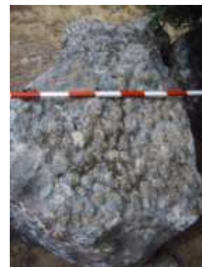
Fig. 3: Bivalvos localizados en posición de vida.

Los corales crecían hacia arriba con vigor pero, como la profundidad era escasa (normalmente entre 0,5 y 1 metro), llegaba un momento en que las colonias de corales alcanzaban el nivel del agua en bajamar. Entonces el crecimiento vertical era sustituido por un desarrollo preferente en la horizontal, con la consiguiente extensión lateral de la llanura arrecifal. Por ello, las colonias de corales muy raramente alcanzan medio metro de altura, aún cuando pueden llegar a ocupar una gran extensión lateral.