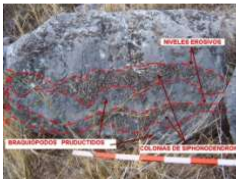
Figura 2: Afloramiento de corales y braquiópodos con niveles de erosión. Cerro de Los Santos.

En el medio, eran frecuentes fuertes tormentas, posiblemente desencadenadas por maremotos dadas las importantes manifestaciones volcánicas presentes en este tramo. Estas tormentas provocaban la destrucción y erosión de los incipientes arrecifes, y hacía que una parte importante de las colonias de corales de Siphonodendron arrancadas se depositaran al cesar la tormenta en la posición más estable (con la amplia copa reposando en el fondo). Dichas tormentas, provocaban un aumento de la turbidez del medio y la destrucción de la abundante vegetación de las costas cuyos restos flotados se depositaban interstratificados entre las conchas y los corales.