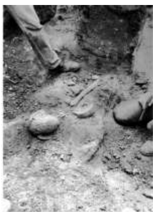
Fig. 7: Cista Bronce Pleno, 1800 a.C. (Foto Blas Castaño).

La continuación del poblamiento de la zona sería algo lógico y posible, sobre todo si se tiene en cuenta el descubrimiento en la primavera de 1982 de una necrópolis de cistas individuales pertenecientes al Bronce Pleno (1800 a.C.). Estas aparecieron al realizar una zanja para colocar tubos de conducción de aguas, muy cerca de la gasolinera de La Glorietta,