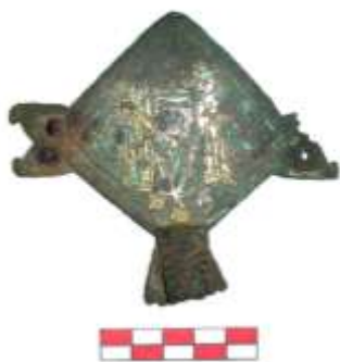
Fig. 21: Remate de estandarte.

De nuevo permanecería en su silencio encerrado hasta que en los años 80, como comentamos durante el calcolítico, la AGRUPACIÓN CULTURAL LOCAL FORSAN actuó allí para recuperar los restos enterrados de la fortaleza. Los restos cerámicos, y de otros tipos recuperados entonces, se encuentran hoy en el Museo Municipal, destacando puntas de flecha de hierro, restos de espadas y de lanzas, monedas del último período de vida del castillo reinando Enrique IV, botones, objetos religiosos (Cruz de Caravaca y Medalla de San Benito) y un excelente remate de estandarte realizado en bronce dorado.