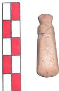
Figura 6: Pequeño ídolo de mármol.

Pero se han encontrado además otros objetos prehistóricos que nos ayudan a matizar esa ocupación. En primer lugar, unas barritas de barro cocido con perforación en un extremo, de forma más o menos cilíndrica conocidas como pesas de telar, junto a otras con doble agujero y forma más o menos rectangular, así como varias fusayolas, lo que representaría una actividad artesanal textil. Se han encontrado también piedras pulimentadas fabricadas con rocas volcánicas hachas o azuelas (piedras de rayo que decían los antiguos) bastante numerosas, de hecho hay que decir que en el Museo Municipal se conservan más de 50 hachas o restos de las mismas, extraídas de sólo dos yacimientos, el del Cerro del Castillo y el de Valle Hermoso. Molinos de mano, en arenisca sobre todo, con una cara perfectamente alisada donde se molían los granos con otra piedra más pequeña, la moledera, de la que también hay ejemplos. En estos molinos de mano podemos observar el brillo característico que deja el cereal al ser sucesivamente frotado. Se conservan alrededor de 40 fragmentos de cuchillos, raspadores, raederas, etc. de sílex, lo que nos atestigua también la talla de la piedra en este lugar.