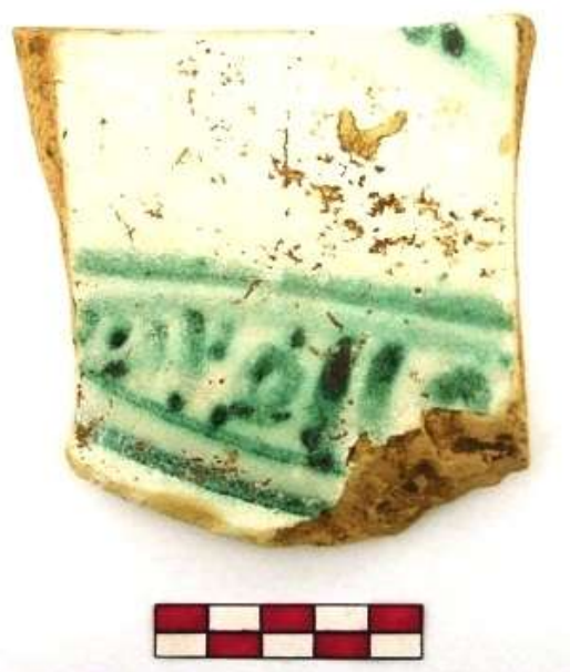
Fig. 17: Cerámica árabe procedente del Castillo.

Considerando que el cerro del castillo estuvo ocupado por los visigodos y este acabó siendo conquistado por los árabes, la fortaleza pasaría a convertirse en un punto importante en la red defensiva musulmana, sobre todo del período almohade, junto con las también fortalezas árabes de Alange, Montemolín, Hornachos y Reina. De esta época son restos de cerámica vidriada que incluye un trozo de plato con grafía árabe. Posteriormente los cristianos conquistarían el lugar tras la toma de Mérida, aproximadamente en 1230 -35, ya que en 1234 cae Alange y un año después le sucede lo mismo a Hornachos. En la escritura de donación de Mérida por Alfonso IX a la Orden de Santiago, el 2 de junio de 1229, los límites de la ciudad llegan hasta la Atalaya