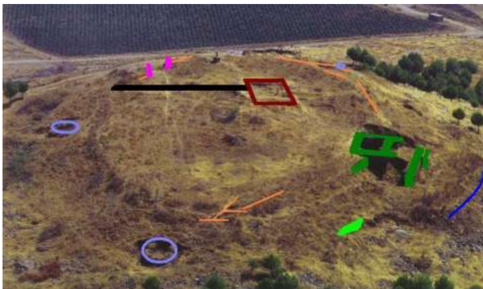
Fig. 20: Principales restos visibles del castillo en la actualidad.

La funcionalidad de la fortaleza santeña no solo fue la militar, cuando se levantó de nueva planta en el siglo XV, también lo fue para cumplir con otras funciones paralelas, administrativas, económicas, políticas, simbólicas, etc.