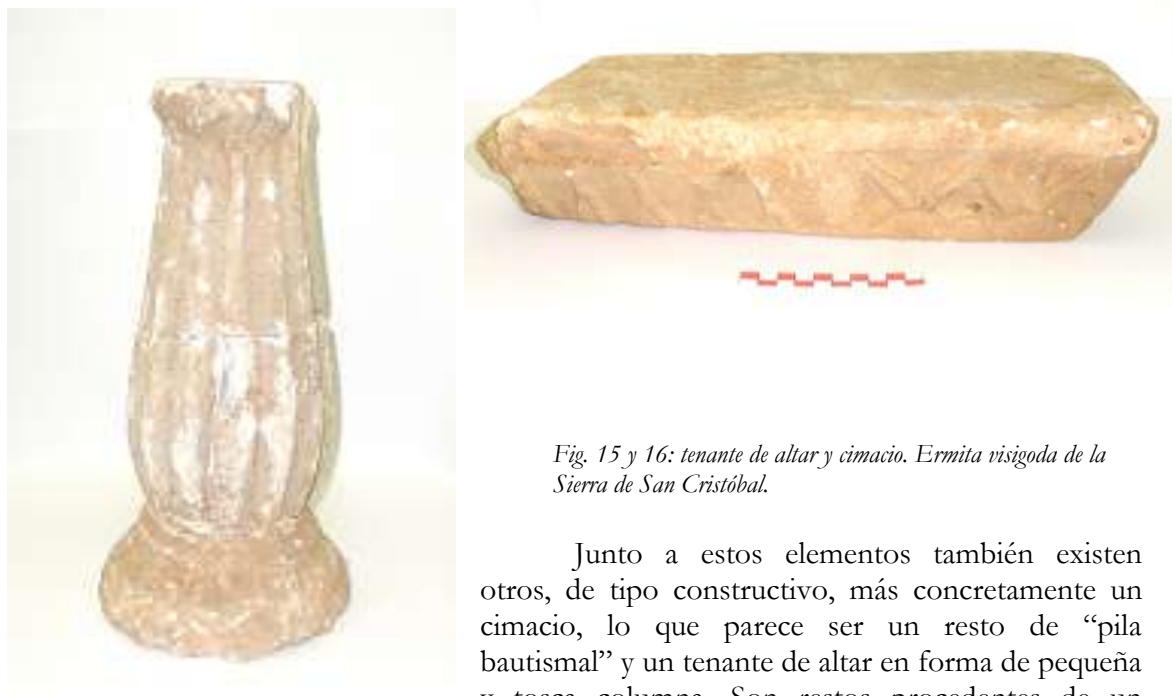
Fig. 15 y 16: tenante de altar y cimacio. Ermita visigoda de la Sierra de San Cristóbal.

Junto a estos elementos también existen otros, de tipo constructivo, más concretamente un cimacio, lo que parece ser un resto de “pila bautismal” y un tenante de altar en forma de pequeña y tosca columna. Son restos procedentes de un edificio religioso, que pudo haber estado situado en la zona de la Parroquia, por la costumbre de colocar los edificios religiosos una cultura sobre otra, como símbolo de prepotencia sobre el vencido, con lo cual pertenecería al mismo conjunto anterior de la fachada de la casa. O bien podría pertenecer a una ermita, que las crónicas más antiguas colocan en la Sierra de San Cristóbal, haciéndose eco de la antigüedad de la misma. Un aspecto que refuerza esta hipótesis se encuentra en el hecho de que estos restos llegaron al Ayuntamiento a mediados de la década de los 60 del siglo pasado, justo cuando se estaban realizando los trabajos de la cantera en la sierra, aún hoy visibles. Situadas estas ruinas en el promontorio más elevado, sus restos murales eran conocidos en el pueblo con el curioso nombre de “El Santo” (si se tiene en cuenta el nombre actual del pueblo “Los Santos”), lugar muy visitado por los niños en sus momentos de ocio y juegos, calificándolo siempre con el mismo apelativo, según me han comentado. La posibilidad de que al llegar las obras de la cantera a ese lugar fueran rescatados los escasos restos que allí se encontraban, son muy grandes, si se tiene en cuenta además que todos los restos pertenecen a un edificio religioso.