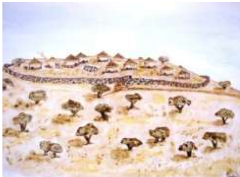
Figura 5: Reconstrucción hipotética del poblado en el Cerro del Castillo, Calcolítico pleno 2500 a.C.

Llamado así normalmente en Los Santos, por la existencia de un castillo medieval en dicho cerro, en realidad su nombre auténtico sería el de Sierra de los Ángeles, aunque nadie la llame así. Es la zona más alta y escarpada con ocupación calcolítica de cuantas se conocen en la comarca, alcanzando los 646 m. de altura sobre el nivel del mar y más de 100 m. sobre el terreno circundante. Se encuentra situado en la cadena de la Sierra de Los Santos, pero destaca perfectamente en el paisaje y desde su cima se divisa una gran porción de terreno que lo convertiría en un magnífico lugar para su ocupación.