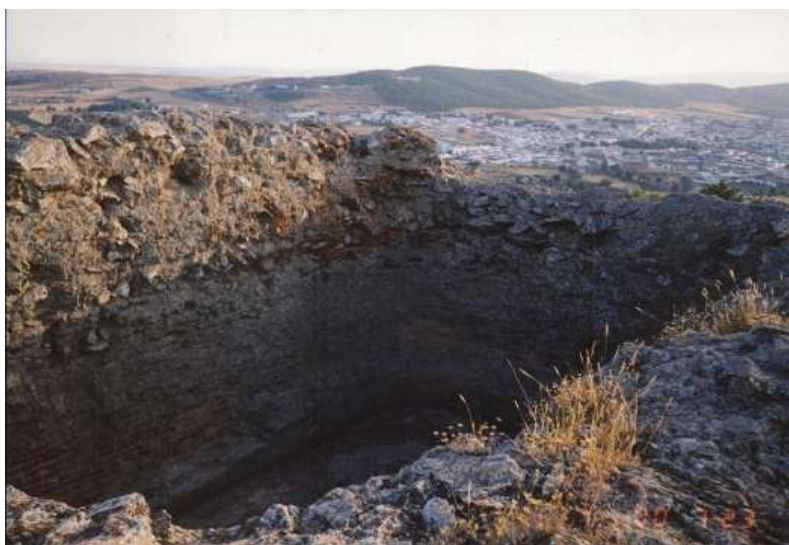
Fig. 18: Restos del aljibe.

De todas formas este aljibe no es óbice para que existan otros repartidos por lo que podríamos llamar patio de armas, hoy completamente ocultos. Hay que decir también que junto al muro este del aljibe se encuentra una pequeña puerta realizada en ladrillo, que podría corresponder a una poterna o puerta secundaria de acceso a la fortaleza.