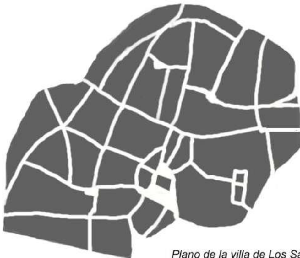
Plano de la villa de Los Santos a finales del siglo XV

límites a la ermita de los Mártires de Los Santos, para desde allí continuar hasta el punto de origen referenciado.