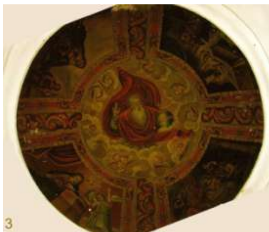
Parte exterior del ábside de la primitiva Iglesia Parroquial y el fresco que se conserva en la bóveda del mismo.

La actual Plaza de España no existía, la parte que ocupa el “Paseo de las Barandas” estaba ocupada por un grupo de casas y por ello la Plaza del Pueblo propiamente dicha era la actual Plaza Chica, La Plazuela entonces 1 .