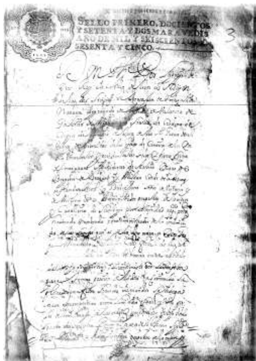
Primera hoja del documento.