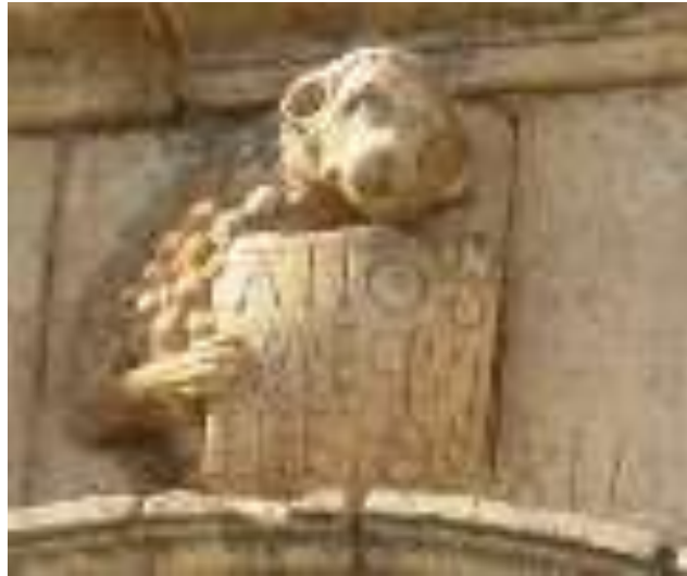
Inscripción: ANOS ME QUINIENTOS XLI