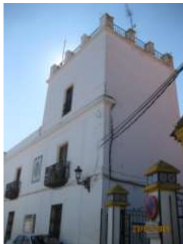
Imágenes actuales de la casa de la encomienda.