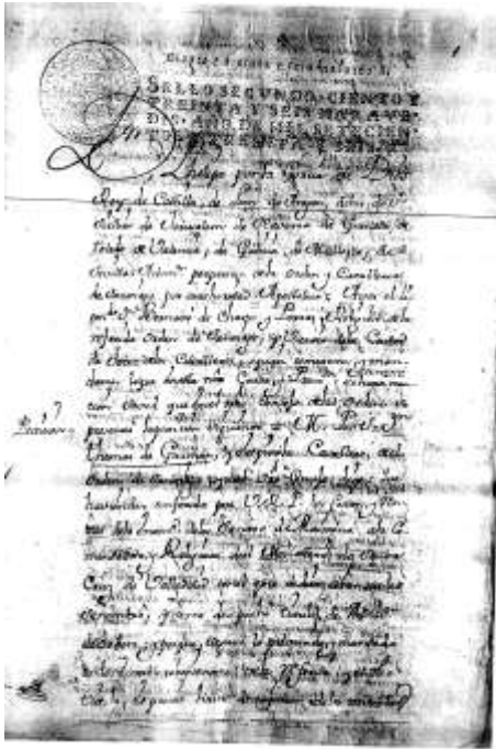
Primera página del documento