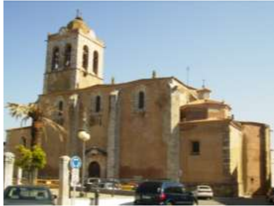
Torre y fachada sur.