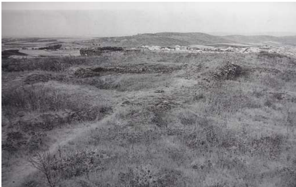
Ruinas del castillo de Los Santos de Maimona.

derribamiento fasta la allanar e poner toda en el suelo de manera que en ella no quede fuerza ni edificio alguno levando.