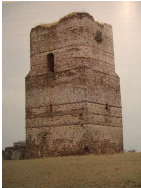
Torre de la fortaleza de Puebla del Maestre