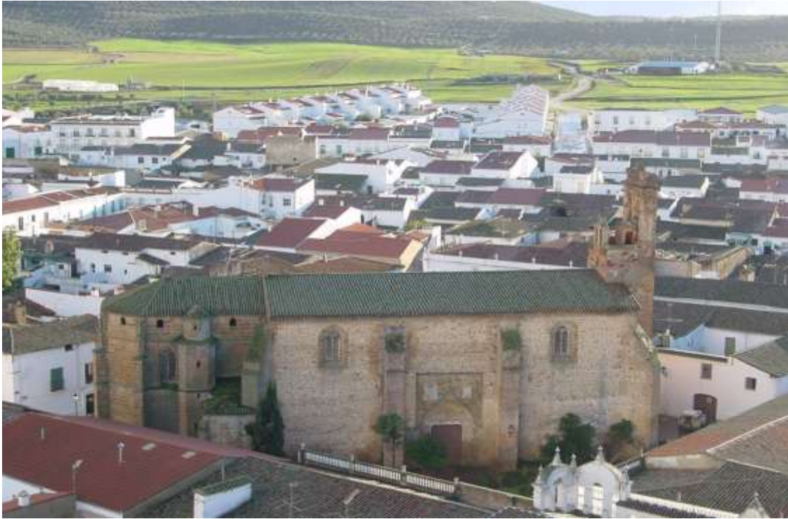
Iglesia de Santiago, Llerena.

De este interesante personaje, en el Diario HOY , el Cronista Oficial de Jerez de los Caballeros y Académico, Feliciano Correa, publicó un documentado artículo vinculándolo en el tiempo y en el espacio al ilustre descubridor del Océano Pacífico Vasco Núñez de Balboa, suceso histórico del que se conmemorará el V Centenario el 25 de septiembre de 2013 9 .