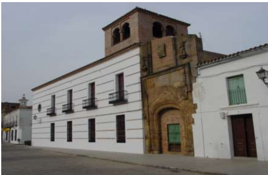
Palacio del licenciado don Luis Zapata, siglo XV. Llerena

En consecuencia, Llerena se convirtió en la capital de los territorios de la Orden, con una gran actividad política, social y cultural, encabezada por dos personajes de capital importancia para el desarrollo de la villa llerenense. Nuestro personaje don Alonso de Cárdenas y el licenciado don Luis Zapata, consejero de los Reyes Católicos y el jurista más prestigioso de la monarquía.