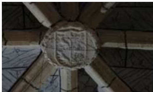
Escudo de la familia Cárdenas Figueroa. Iglesia de Santiato. Llerena.