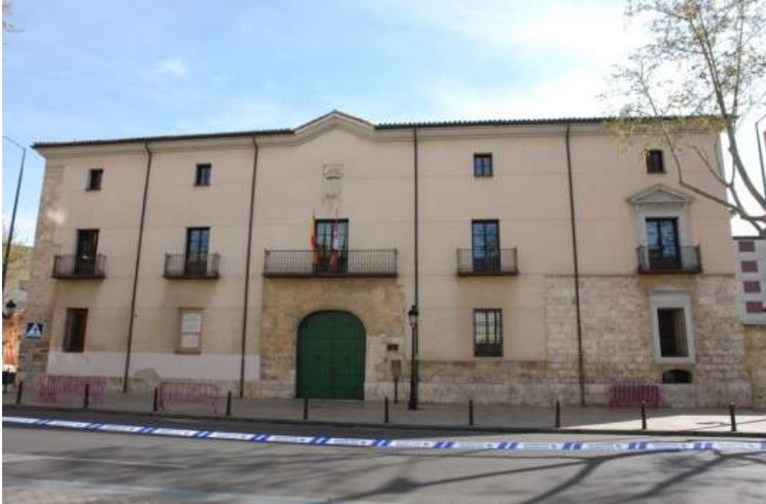
Casa de Juan de vivero. Valladolid

18 años, y Fernando con 17, durante el acto de presentación de los novios, en la casa de Juan de Vivero, estaba presente don Alonso, en compañía del arzobispo Carrillo; cuando entró la comitiva en el salón del edificio, entre la que se encontraba el rey de Aragón, don Alonso le susurró en el oído a Isabel, señalando a Fernando, “ese es”. Como recuerdo de aquella anécdota la reina Isabel incluyó las dos “SS” en su escudo 14 .