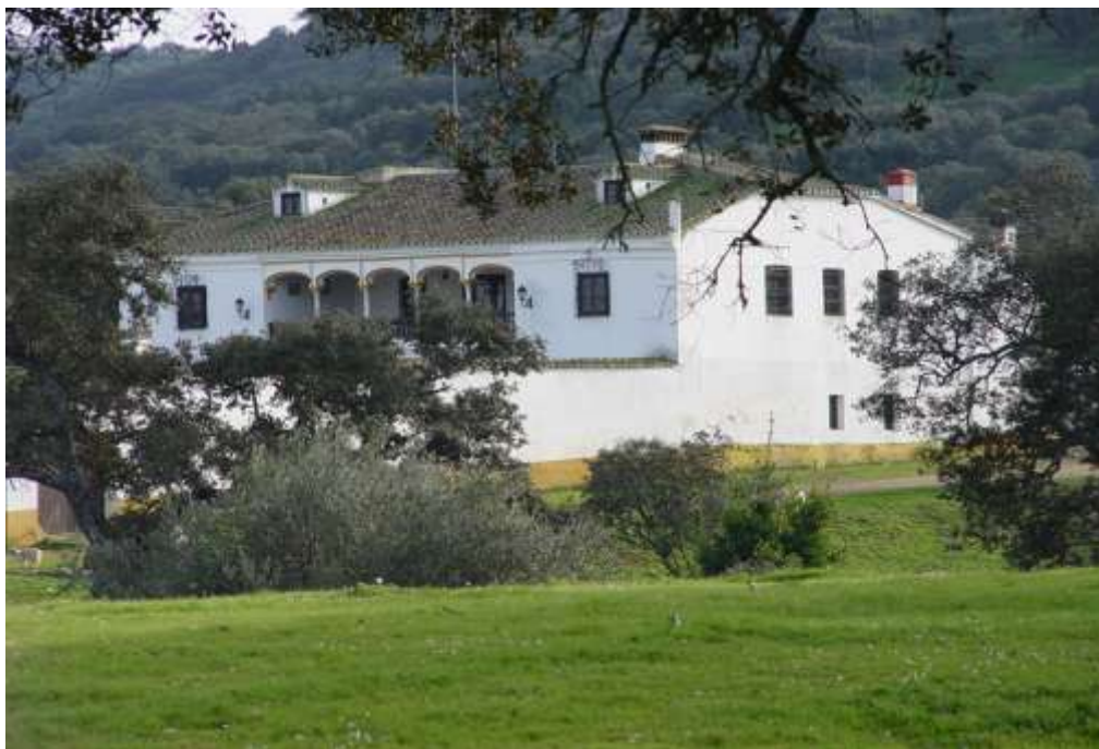
Cortijo de La Matilla. Puebla del Maestre