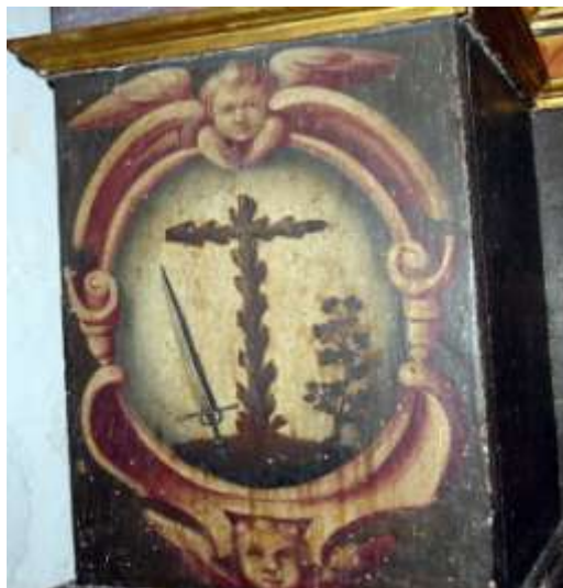
Escudo de la Inquisición. Convento de Santa Clara. Llerena

Además Llerena contaba con una de las comunidades judías más importantes de Extremadura a finales del siglo XV. En 1474 tenía una aljama con aproximadamente 100 familias, y lo que no cabe duda es que tras su expulsión de Andalucía los hebreos aumentaron considerablemente, como se deduce por el censo realizado por los Inquisidores de la Provincia de León 44 y que publiqué en la Revista de Estudios Extremeños en 1996. Una vez cuantificado dicho censo, realizado entre el 10 de noviembre de 1492 y el 31 de agosto de 1495, aparece que en Llerena fueron inhabilitadas 125 familias conversas que pagaron sus maravedíes correspondientes para que les fueran retirados los hábitos perpetuos que sus antepasados habían tenido. Este número de familias supone algo más del 11,36 por ciento de los vecinos de Llerena. Este porcentaje sobre la población judía antes del decreto de expulsión, podría ser más elevado. Es difícil establecer cuantos son los que se fueron porque que no existen censos ni recuentos de vecinos con fecha anterior a 1492.