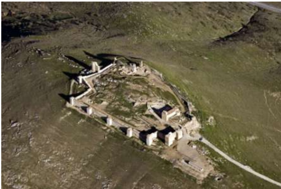
Fortaleza de Reina

aumento de torres, muros y adarves, así como la ampliación de la residencia del alcaide 37 . El 31 de agosto de 1475, le fueron confirmados sus privilegios a Reina, para remunerar los servicios que había hecho y hacía en reparar el castillo 38 .