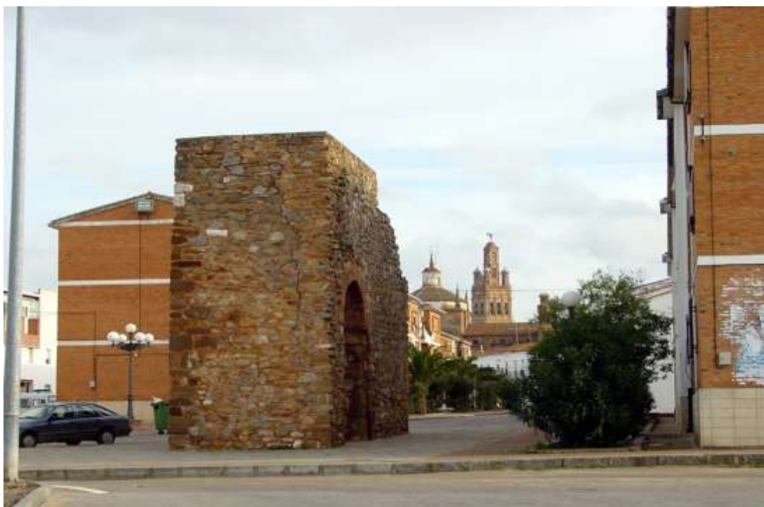
Puerta de Villagarcía. Llerena

En la entonces villa de Llerena, el monasterio de Santa Elena, de la orden de San Francisco, situado en extramuros de ella, sufragó la ampliación y reforma del edificio, levantó una nueva planta para dormitorio de los frailes, y elevó la cerca de la huerta con cal y piedra. También subió la muralla de la Puerta de Reina de Llerena con sus barreras y cavas alrededor, y realizó el asentamiento de la puerta de Villagarcía de Llerena 35 .