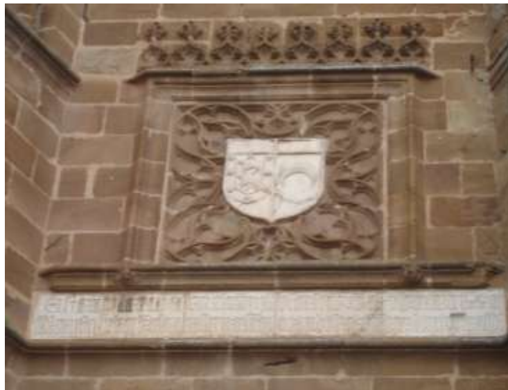
Escudo de la familia Cárdenas Luna. Iglesia de Santiago. Llerena