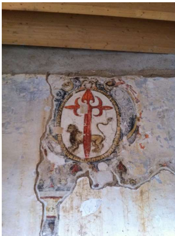
Escudo de San Marcos de León. Palacio Episcopal. Llerena

Seguidamente, el prior de San Marcos de León don Gómez de Miranda, con la autoridad que le conferían las normas de la Orden, convocó la reunión del Capítulo General en Llerena para proceder al nombramiento de don Alonso de Cárdenas como nuevo Maestre de la provincia de León. A continuación, el día 16 de junio de 1475, en Ávila, le fueron ratificadas todas sus mercedes por los Reyes Católicos que aún no habían recibido la confirmación papal para asumir éstos la administración 18 . Cuatro días después, el 20 de junio, todavía en Ávila, todos los privilegios que los reyes le concedieron a don Alonso, los maravedís, doblas, florines, pan y excusados de sus dominios, les fueron confirmados por el Consejo Real 19 .