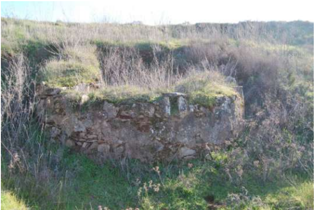
Fotografía 2: cubo artillero norte