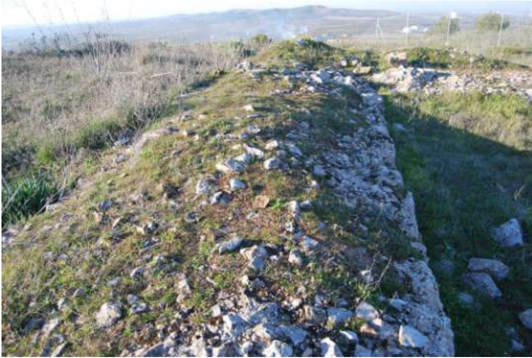
Fotografía 1: Muros de la torre del homenaje