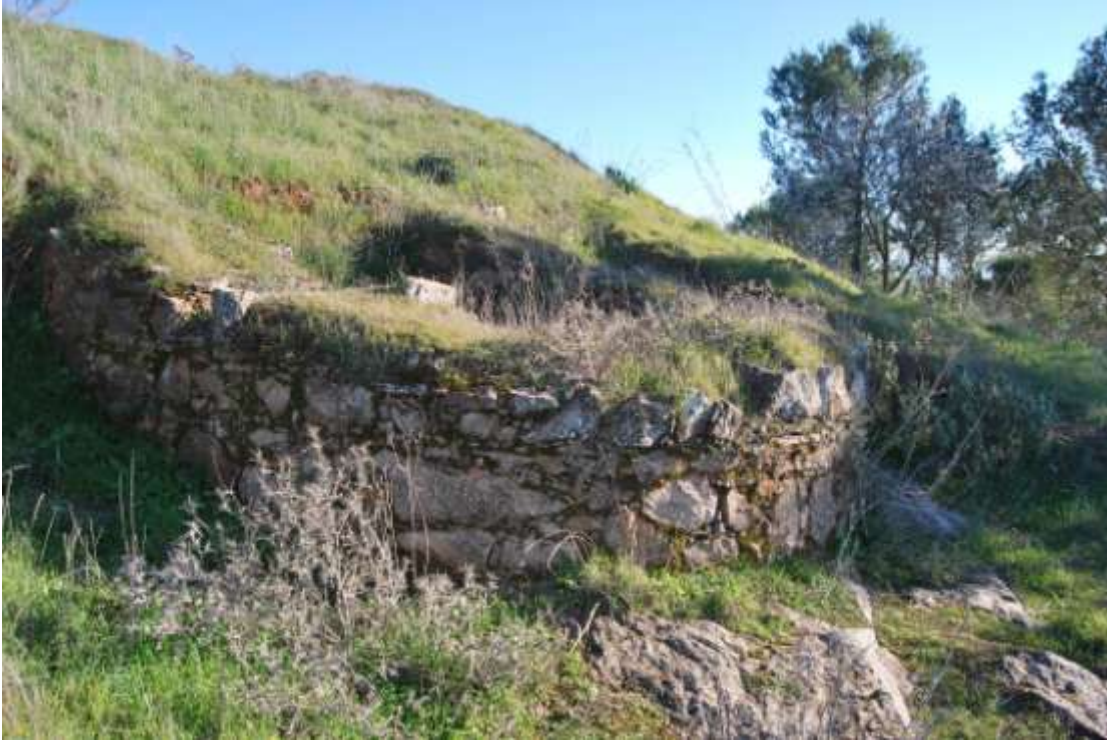
Fotografía 3: cubo artillero noroeste