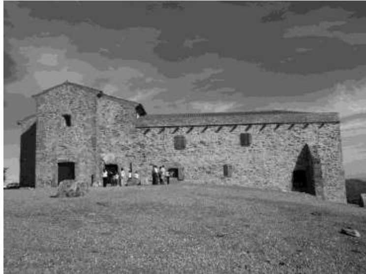
Fachada occidental del monasterio de Tudía en la actualidad. Aquí se puede apreciar la entrada a la iglesia, a la izquierda, y junto a ella la correspondiente a la entrada de la claustra del convento.

Mientras se hacían todas estas obras, y más concretamente a finales del año 1510, llegaron al monasterio de Tudía los restos mortales del maestre Pelay Pérez Correa procedentes de la iglesia del Hospital de Talavera (Toledo). El traslado de los mismos se había hecho por orden del rey Fernando el Católico y con el consentimiento del cardenal Cisneros, quien dirigió una carta a las autoridades de Talavera para que la exhumación de los restos del maestre santiaguista se hiciera con la solemnidad que merecía 154 . En esta dinámica de reformas, llegaron los visitantes de la Orden en mayo de 1511 a la iglesia de Tudía 155 y son ellos los que informan al monarca que en el lado del Evangelio había “un arca en la qual estava un caxon con los huesos del dicho maestre que Vuestra Alteza mando alli trasladarlos”. Por otro lado, estos visitantes ordenaron al mayordomo la terminación de las obras pendientes y el comienzo de otras que ellos consideraron conveniente realizar, fijando plazos para la terminación de las mismas. Pero ni se cumplieron éstos ni las obras se realizaron tal y como se proyectaron, según podemos comprobar en el Libro de Visita de 1515.