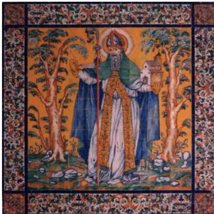
Retablo del altar situado en la capilla de los Maestres en la iglesia de Tudía. Su autoría, al igual que el retablo de la capilla de Santiago de la misma iglesia, ha sido atribuida al ceramista sevillano Cristóbal de Augusta.