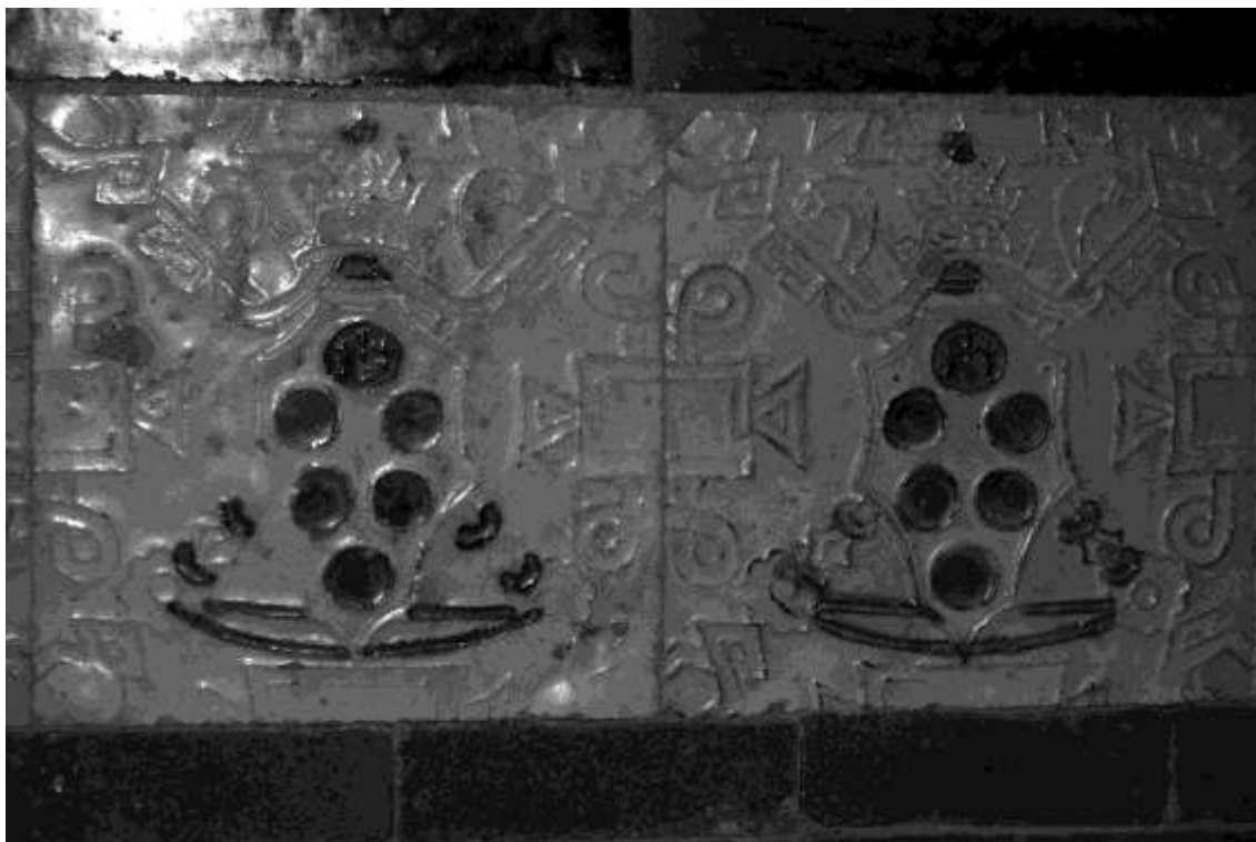
El último peldaño de la escalinata que sube al altar mayor de la iglesia de Tudía se decora con azulejos donde campea el escudo del papa León X, pontífice que en 1514 concedió la bula para la fundación del monasterio de Santa María de Tudía.

El papa León X accedió a tal petición y gracias a su bula 21 , extendida en julio de 1514, podemos conocer las más restrictivas condiciones a las que habría de ceñirse el nuevo vicario de Tudía; entre ellas destacaremos aquí que el nuevo titular había de residir en el monasterio recién terminado, junto a ocho religiosos santiaguistas, y bajar a Calera una vez a la semana para atender a sus funciones judiciales. Si lo anterior ya resulta significativo por sí mismo, más todavía lo es que al vicario se le asignara un sueldo anual como pago por tales funciones judiciales, cosa que antes no sucedía.