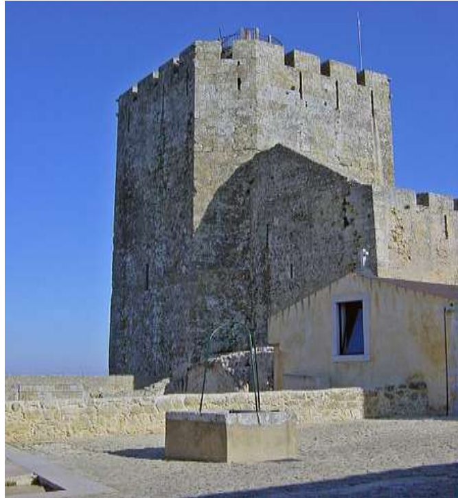
Imagen. Torre del Homenaje del castillo de Palmela.

Su primera participación en un conflicto armado tuvo lugar en 1807 con motivo de la invasión francesa de la Península Ibérica, que había sido acordada entre Godoy, hombre fuerte del monarca Carlos IV, y Napoleón con el objetivo de ocupar Portugal y proceder al reparto de este reino entre ambos países 3 . En el país vecino cayó prisionero del ejército francés-en su hoja de servicios no dice por qué- y estuvo recluido en el castillo de Palmela aunque consiguió escapar a España 4 . Las intenciones de Napoleón fueron muy diferentes a las que se había estipulado, puesto que el ejército francés ocupó España en 1808 dando inicio la Guerra de la Independencia.