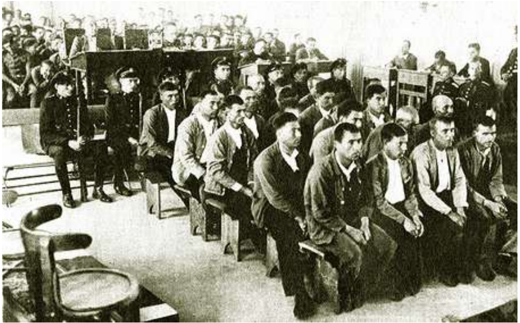
Consejo de guerra contra los campesinos acusados por los sucesos de Castilblanco. El fiscal pide ocho penas de muerte y varias cadenas perpetuas.

Otro suceso que puede servir de ejemplo de la enorme tensión social que se vive en el campo ocurre el 11 de enero de 1933. La Guardia de Asalto se enfrenta a los campesinos en Casas Viejas, provincia de Cádiz, y conmina a rendirse al cabecilla de la rebelión en el pueblo, que se esconde en su casa. Ante la negativa, los agentes abren fuego matando a todos los habitantes de la casa y, a continuación, prenden fuego al lugar. Al mismo tiempo, un pelotón de la Guardia de Asalto fusila de manera irregular a catorce prisioneros. Ante estos acontecimientos varios diputados de diferentes partidos se ponen en contacto con Azaña para proponerle una Dictadura como medio para acabar con la inestabilidad social.