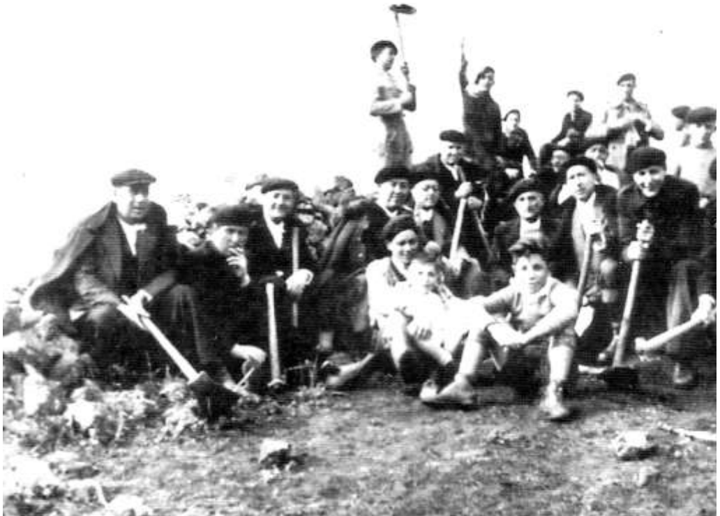
Trabajadores en la Sierra. 40

tienen sus parcelas; como consecuencia de ello, el Benemérito Cuerpo denuncia a dos vecinos por pastoreo abusivo en la sierra de San Cristóbal, en otra ocasión se denuncia a cuatro vecinos por la misma causa en esas parcelas de la Sierra, y a comienzos de junio a otros dos más.