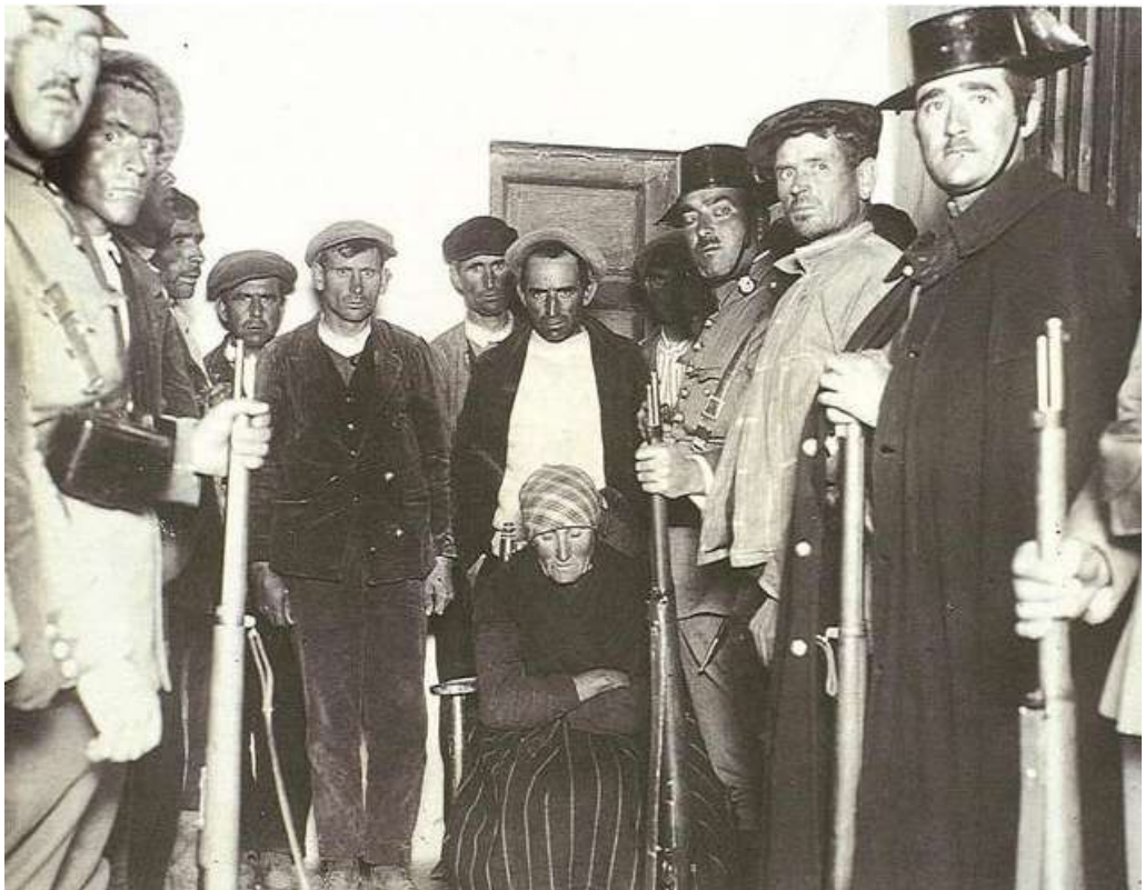
Detenidos tras los sucesos de Castilblanco

propietarios de la tierra. Dos días después el alcalde envía a la Guardia Civil a la Casa del Pueblo, sede la FNTT, para pedir que se cancele una nueva manifestación prevista para aquel día. Mientras negocian los civiles y los sindicalistas, un grupo de mujeres insulta a los cuatro guardias civiles que están fuera. Pero uno de los guardias, al tratar de impedir la entrada en el local, dispara un tiro y resulta muerta una persona. A continuación, la muchedumbre se abalanza sobre ellos con palos, piedras y cuchillos y los lincha allí mismo con ensañamiento. La opinión pública y la clase política se estremecen con lo ocurrido y los cabecillas del linchamiento son finalmente condenados a cadena perpetua.