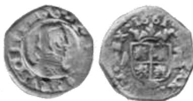
Fig. 2. Moneda de VIII maravedís de la serie acuñada entre octubre de 1660 y octubre de 1661 (segunda serie de vellón de busto). Este ejemplar procede de la Casa de la Moneda de Madrid (“MD”), ceca “Calle Segovia”, ensayador “A”, año 1661.

3ª emisión, acuñada desde octubre de 1661 a octubre de 1664, compuesta por vellones auténticos a molino en todas las cecas, siguiendo modelo de la serie dos, con la particularidad de que todas las monedas auténticas están realizadas a molino.