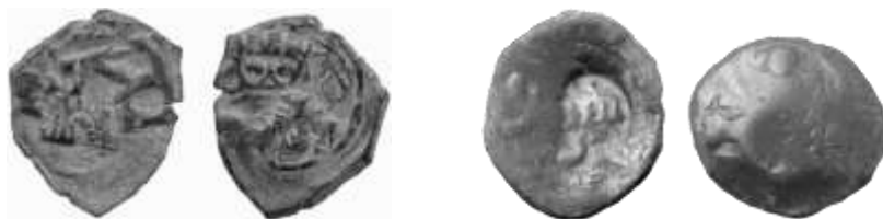
Fig. 4. Dos ejemplos del estado en que pueden quedar algunas monedas fruto de las sucesivas leyes de resellado entre los años 1603 y 1659. La primera es una moneda de 2 maravedís de la ceca Madrid acuñada entre 1621 y 1626, a la que le han aplicado al menos un resello de 2 maravedís de 1658-59. El segundo ejemplo pueden ser 4 maravedís de los RR.CC. Carlos I o Felipe II, es decir una moneda de calderilla, siendo visible un resello de IIII maravedís, pero cuyo desgaste y sucesión de resellos hace imposible determinar más datos, siendo posible que sea una falsificación.

Los ejemplos siguientes son testigos de las consecuencias de la reiterada manipulación oficial de la moneda con punzones de resello, de tal modo la moneda de vellón se había convertido en una chapa metálica sin signos claros de lectura.