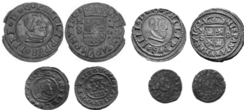
Fig. 3. Monedas oficiales y legales acuñadas a molino entre octubre de 1661 y octubre de 1664 (tercera serie de vellón de busto): 16 y 8 maravedís Casa de la Moneda de Madrid (“M”), ceca “Molinos de la Puerta de Alcalá”, ensayador “S”, años 1663 y 1662; 4 maravedís de Granada, 1663, ensayador “N” y 2 maravedís de Cuenca, 1663, ensayador “CA”.

martillo, dando 30 días de plazo para su retirada y para comenzar su conversión en otra nueva a molino. Madrid, 30 de octubre de 1661. AHN, Reales Cédulas, 5136; incluimos una columna con la talla adaptada a gramos.