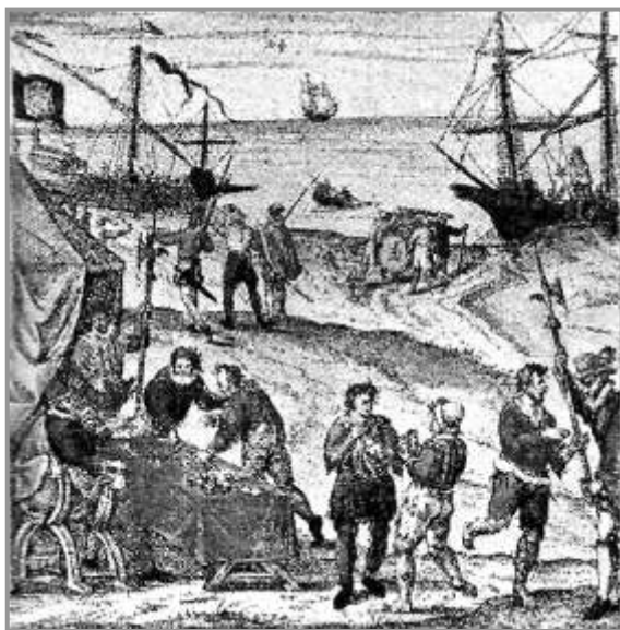
Fig. 6: Fragmento de grabado del siglo XVI en el que se observa una mesa de alistamiento y de cambio monetario en un punto cualquiera de la costa, no en un puerto, lugar donde era más fácil traficar de contrabando la introducción de monedas falsas de vellón elaboradas en el extranjero.

de monedas de vellón auténtico entre Castilla y el extranjero se fundamenta en que éstos ejemplares contenían plata. Los delincuentes extranjeros la adquirían del interior de Castilla y la transportaban hasta el extranjero para fundirla y obtener de su pasta la plata contenida. Con ello se redujo por tanto la plata circulante en Castilla, mientras el cobre resultante de la fundición se reutilizaba fabricando monedas falsas de solo cobre que volvían a Castilla. Por otra parte, y a través de los puertos y fronteras, los falsarios extranjeros se ofrecían a comprar plata pura castellana en pasta o amonedada ofreciendo cantidades fabulosas de monedas de vellón, toda falsa obviamente, haciendo ascender el premio en toda Castilla hasta cifras exorbitantes. Como por ejemplo de estas altas cifras, citaremos el rumor que anunciaba pagos con hasta un 525 % de premio 45 .