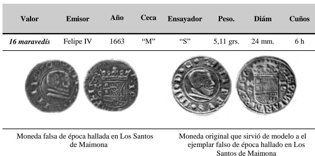
Cuadro 5. Catalogación de la moneda falsa hallada en Los Santos de Maimona 48 .

Descripción de la moneda auténtica y la falsificación que circuló en Los Santos de Maimona: Moneda falsa de época que copia una pieza de 16 maravedís, las llamadas popularmente “carillas”, a nombre del rey Felipe IV, acuñada el año 1663. Anverso: Busto engolado de Felipe IV a derecha; leyenda marginal: “PHILIPPVS • IIII • D • G”. Reverso: Escudo coronado de los territorios de la Monarquía Austria española, incluido Portugal; a derecha “16”, a izquierda en palo “M / S”; leyenda marginal: “HISPANIARVM REX