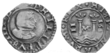
Fig. 1. Moneda de 2 maravedís acuñada entre septiembre y octubre de 1660 en la Casa de la Moneda de Madrid (“MD”), ceca “Calle de Segovia”; primera serie de vellón de busto.