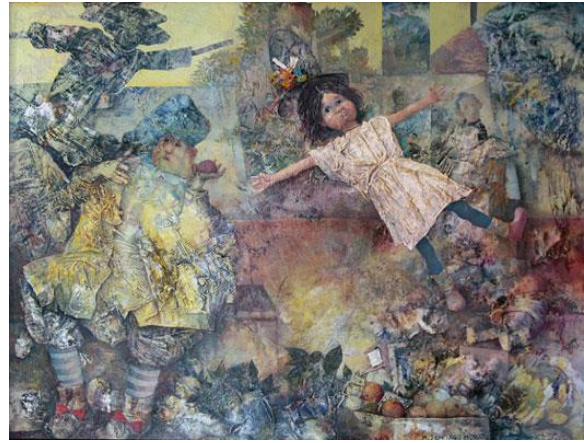
La última muñeca , 1974