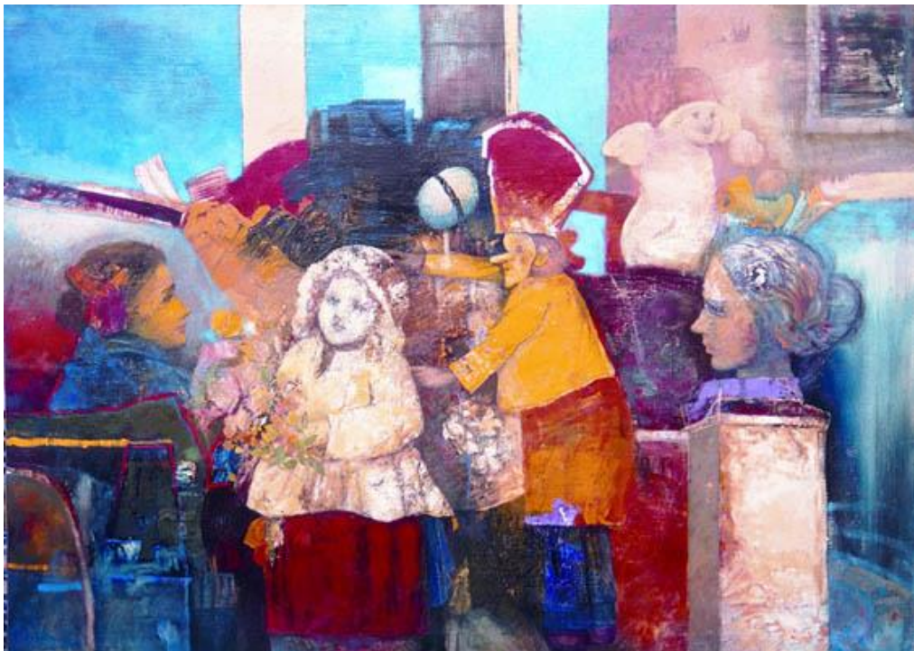
Mujeres con figuras, 2001