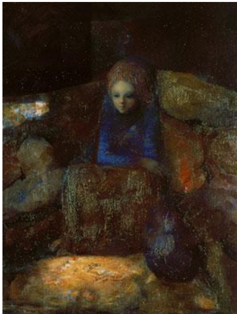
Niña pobre, 1966