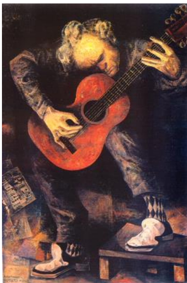
El guitarrista, 1960

Supera la prueba de acceso en la Real Academia de Bellas Artes de San Fernando con una reproducción en carboncillo del Doríforo de Policeto, en la que se pudo comprobar que el dominio del dibujo lo llevaba ampliamente superado. Coquetea con los ismos de principio de siglo: el Niño Cubista , el expresionismo en La Carbonera o El Bohemio , recordando a su admirado Picasso. Empieza a usar la exaltación de color como recurso estético, característica fundamental en toda la obra del autor. Los temas son diversos y el realismo sigue presente en su obra como en El Guitarrista , Mujer cosiendo o en el ambiente metafísico de Bodegón de las estatuas . Maternidades, niños y arquitecturas cubistas siembran su producción. Le gustan los colores terrosos y los empastes densos. A finales de los años 70 se aprecian ya plenamente la factura temática y estilística que nos hace reconocer un “Santiago Morato”. Recibe premios, se consagra como pintor.