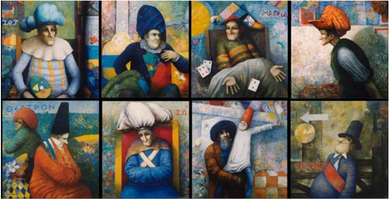
Homenaje al teatro. 1988