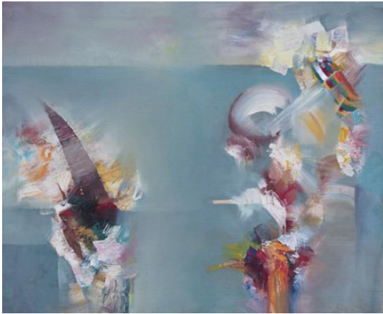
Ráfagas de luz , 1971

Tras su vuelta de París, con una situación profesional totalmente asentada, empieza a desarrollar su obra más personal y obtiene grandes éxitos profesionales como la Medalla de Plata en la IV Bienal Extremeña en 1970 con La última muñeca . Inició a partir de este momento un doble camino, el del éxito en certámenes y el asentamiento definitivo de su estilo, que bien podríamos definir como de realismo mágico o expresionismo onírico . Llena sus cuadros de personajes del teatro, de esa “manera tan peculiar de ejercer la tristeza” 15 . El azar inunda su obra. No busca a sus personajes, si no que en la propia mancha los encuentra. Todos están detrás de los empastes en las viejas paletas, en las veladuras de los papeles. Un mundo de ensueño y magia, cargados de la melancolía de lo que pudo haber sido, pero no pudo ser.