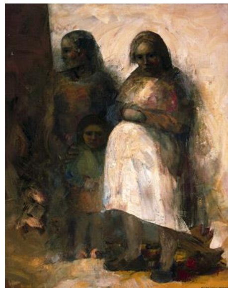
Mujeres de barrio, 1962