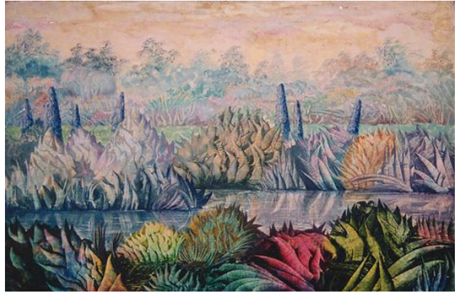
A Rosseau II, 1964