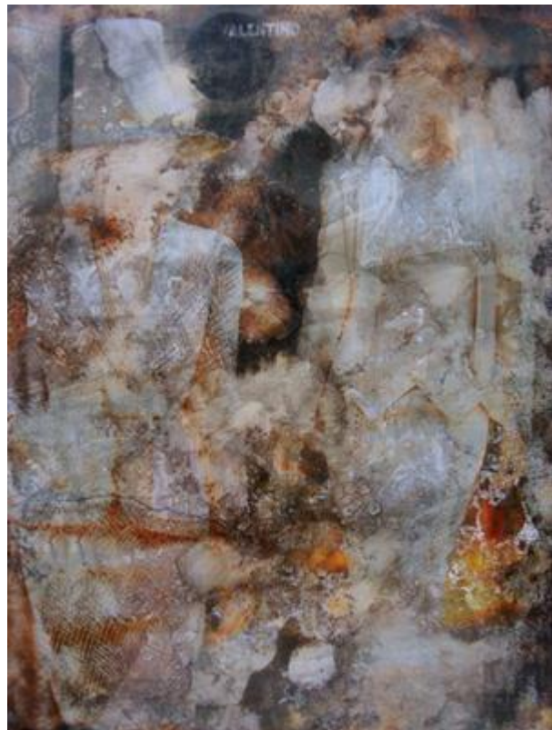
Dos ejemplos de los denominados “ Papeles ”, sin título