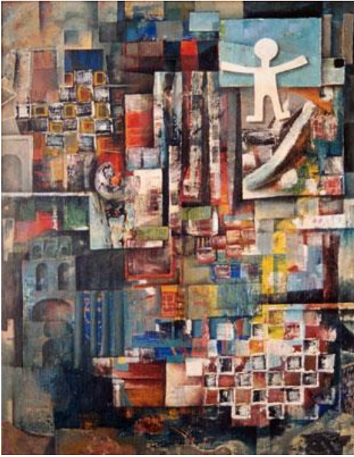
Muñeco y colores, 1963