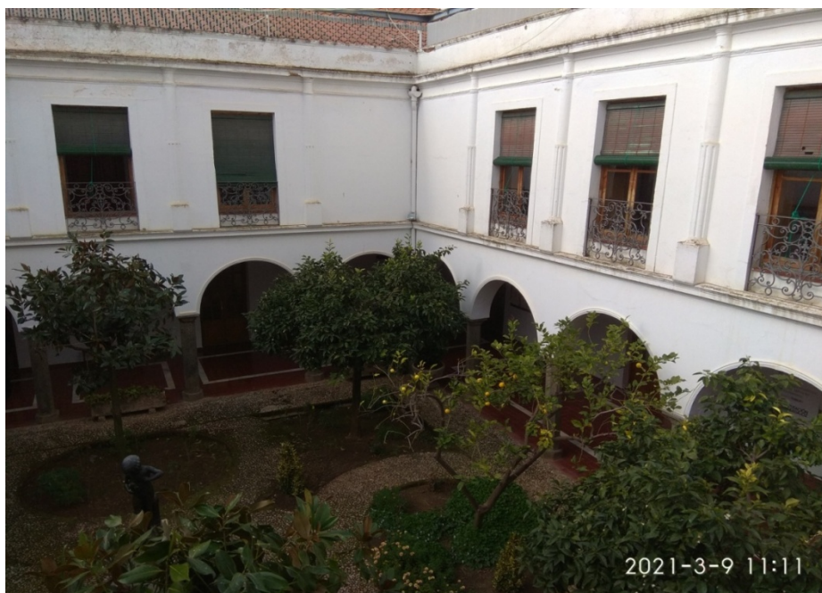
La última reconstrucción del edificio ha sustituido las arquerías de la planta superior por ventanales.

estancias. De aquí se iba a otro corredor, el del fondo, donde había una estancia grande que tenía una chimenea francesa y a su derecha una escalera que bajaba a la planta baja y al corral. Continuaba el siguiente corredor con dos estancias y de allí se iba al corredor frontal, que era la parte noble de la casa donde, a través de un arco de ladrillo, se entraba a una gran sala de cuarenta pies de largo por dieciocho de ancho, donde estaban las ventanas hechas con mármol de Estremoz y una chimenea francesa, a la mano derecha una sala con otra chimenea francesa y otra pieza más con una ventana y a la izquierda otra sala mas con otra ventana de mármol, todo ello dando a la calle principal. Desde esta cuadra se entraba a otra que estaba debajo de la torre, la cual tenía otra ventana con otro mármol. Desde aquí a través de una escalera se subía a otra cuadra alta cubierta con bóveda de ladrillo y todavía, a través de otra escalera estrecha y abovedada de ladrillo, se ascendía a la azotea de la torre, la cual era de arcos de ladrillo y pilares, tres arcos en los hastiales envolventes y dos en el frontal, que estaban tapados a causa de la caída de las aguas de los tejados y del hostigo, causa quizá del derrumbe de la primera torre.