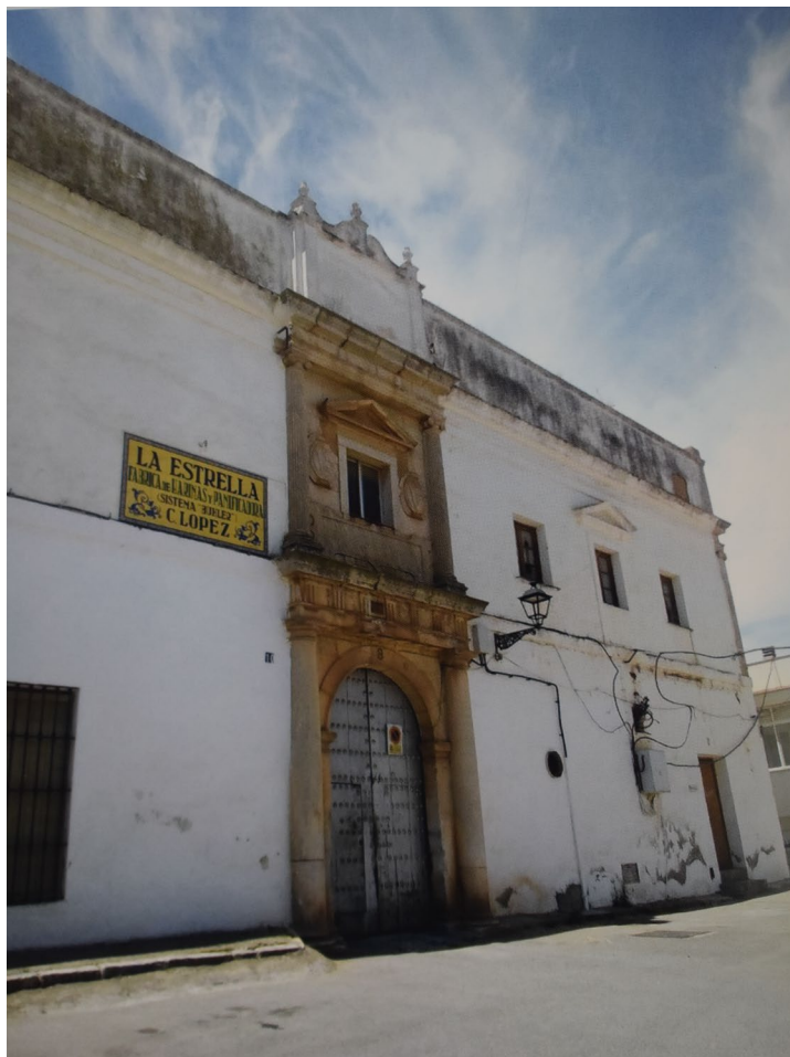
Fachada del primitivo hospital fundado por el licenciado Álvaro de Carvajal.

protocolizó su testamento 86 . Pese a su debilidad física consiguió llegar a Sevilla, donde falleció en 1591, siendo su cuerpo trasladado años después al panteón familiar en el hospital que fundó en su localidad natal.